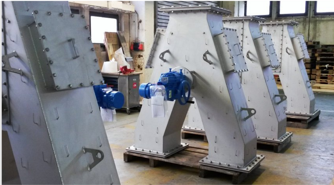
Wegeverteiler mit Stellantrieb